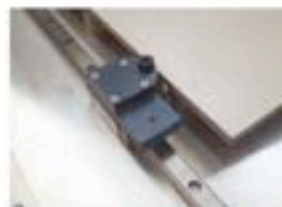
appoggio piastrella tile support