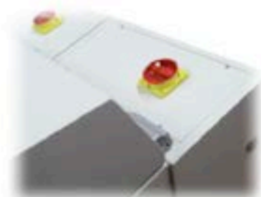
Particolare interruttore generale View of the main switch