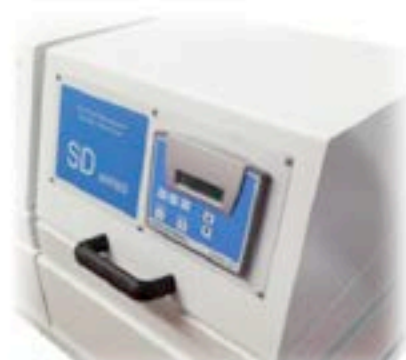
Pannello di controllo Control panel