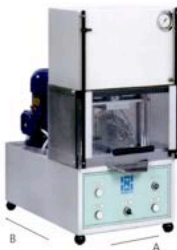
PRESSA MIGNON-S [20 TON]

The mould, located on the working table, is filled manually with the powder to be pressed and after the pressing, the sample obtained is extracted by means of a die in the lower part. The pressing force can be regulated manually and can be read on a pressure gauge at the upper part of the front.