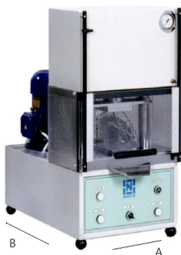
PRESSA MIGNON-S [20 TON]

The mould, located on the working table, is filled manually with the powder to be pressed and after the pressing, the sample obtained is extracted by means of a die in the lower part. The pressing force can be regulated manually and can be read on a pressure gauge at the upper part of the front.