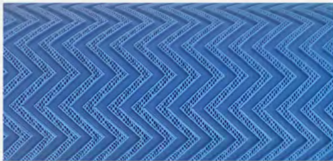
INCISIONE A RILIEVO