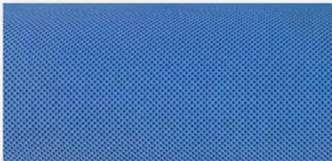
INCISIONE A NIDO D'APE